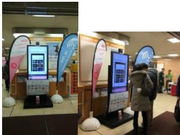
図 5 デジタルサイネージによる情報発信 (イメージ)