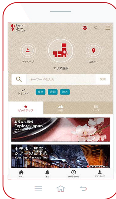
図2 「Japan Travel Guide」の画面（イメージ）

(※) 「Japan Travel Guide」の詳細は、以下の URL をご参照ください。