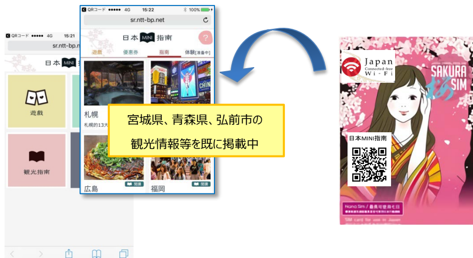
図3 繁体字 HP（イメージ）

情報発信をご希望の自治体様等は、本リリース末尾記載の問い合わせ先（NTTBP）までご連絡ください。（毎月 15 日㊦、翌月掲載）