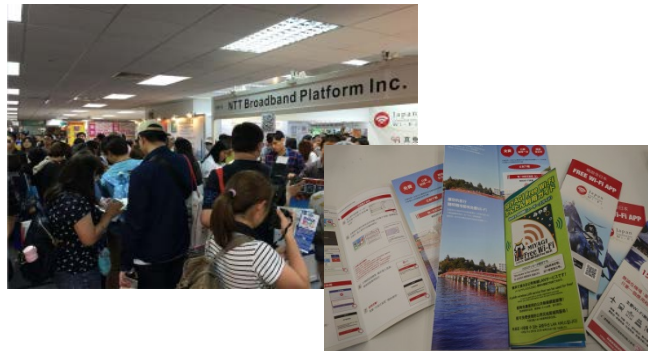
図 4 海外イベントでの情報発信 (イメージ)

海外で開催されるイベントに出展し、東北の観光情報を発信します。「台湾国際動漫節 2017」(2月2日～6日、台北)において、宮城県及び新潟市の観光情報や Free Wi-Fi サービス等について、パンフレット、ポスター等による情報発信を行います。